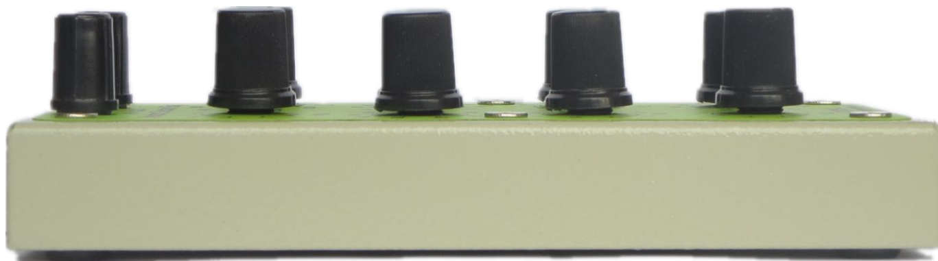
图 5. ATRDB12 的侧视图