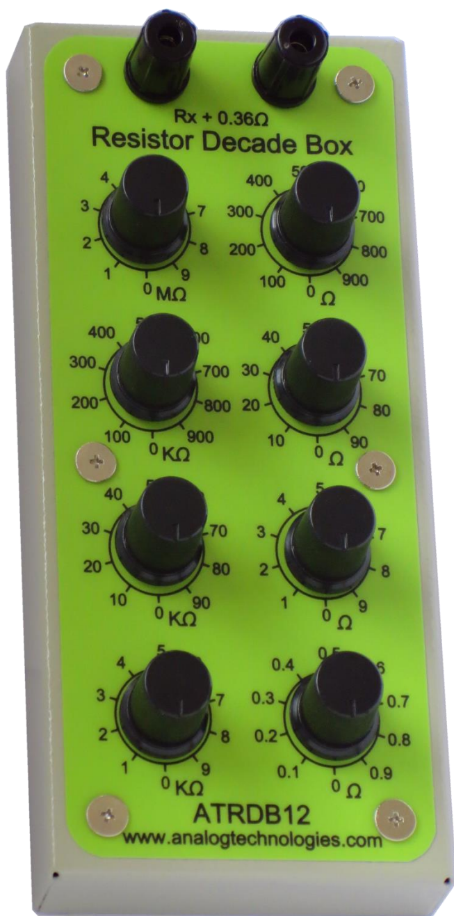
图 1. 可调电阻盒 ATRDB12