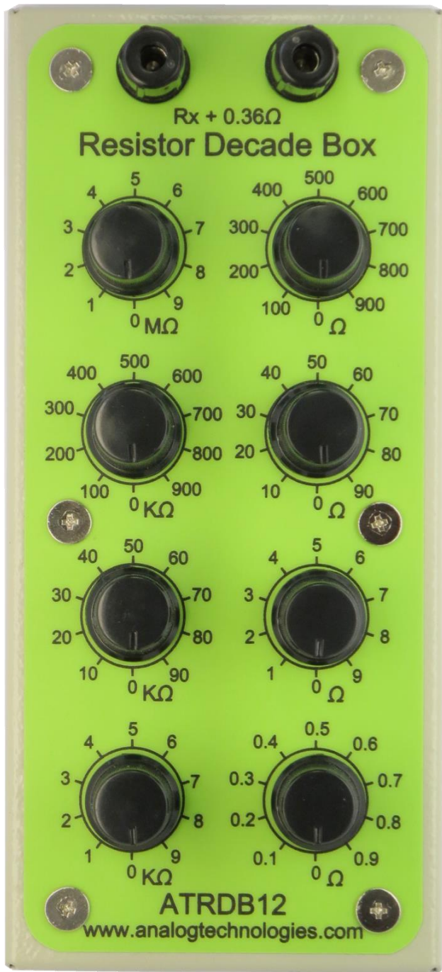
图 2. ATRDB12 的俯视图