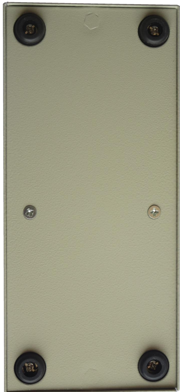
图 3. ATRDB12 的底视图