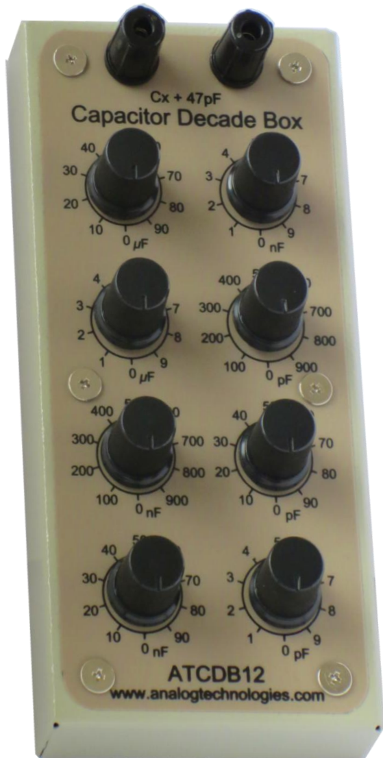
图 1、可调电容盒 ATCDB12