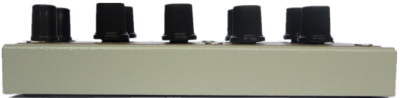
图 5、ATCDB12 侧视图